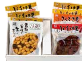
しょうゆ豆セット