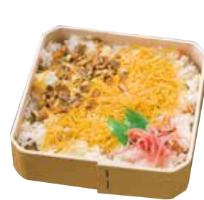
バラ寿司 (折箱入り)