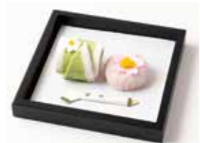
寺院用 お茶セット 550円(税込)