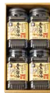
かき醤油味付のり